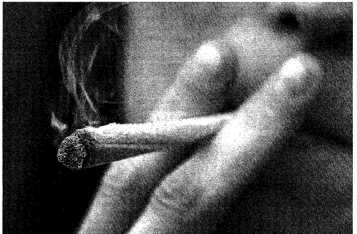
La Policía Local abrió un expediente sancionador a 105 chicos y 31 chicas.

¿En qué consiste esta actividad? Sus responsables lo definen como «un recurso psicoeducativo basado en entrevistas motivacionales para