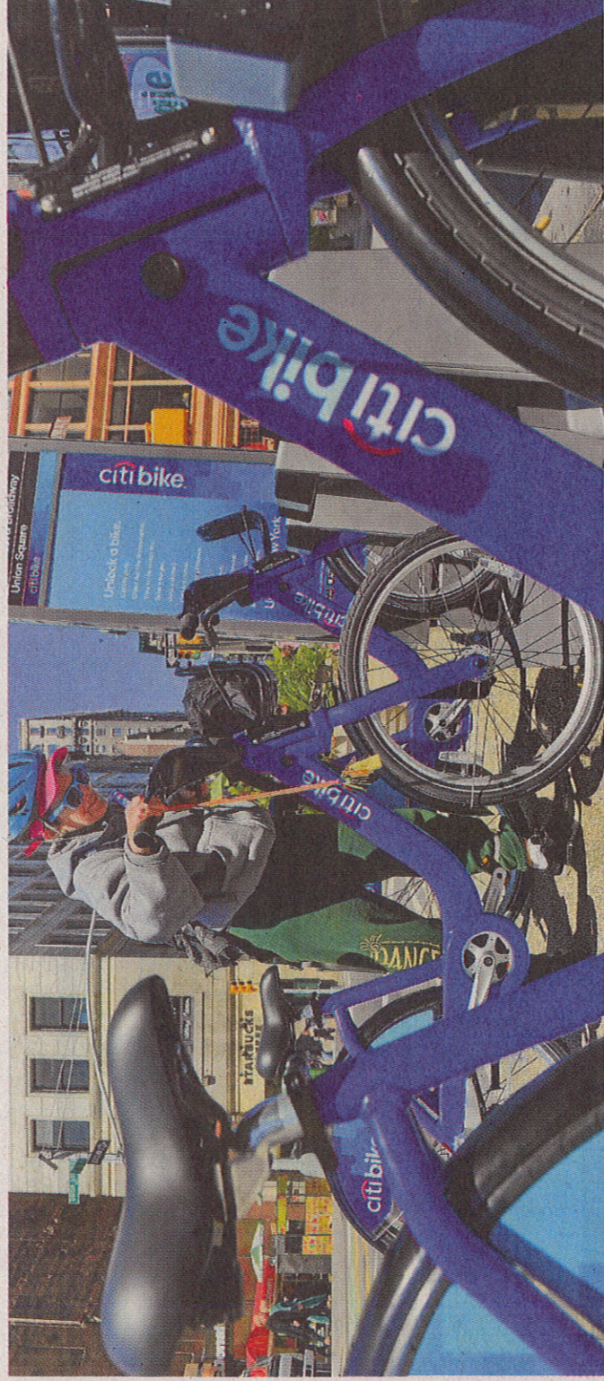
El Ayuntamiento eligió el mismo modelo de bicicleta de alquiler que funciona en Nueva York y Londres.