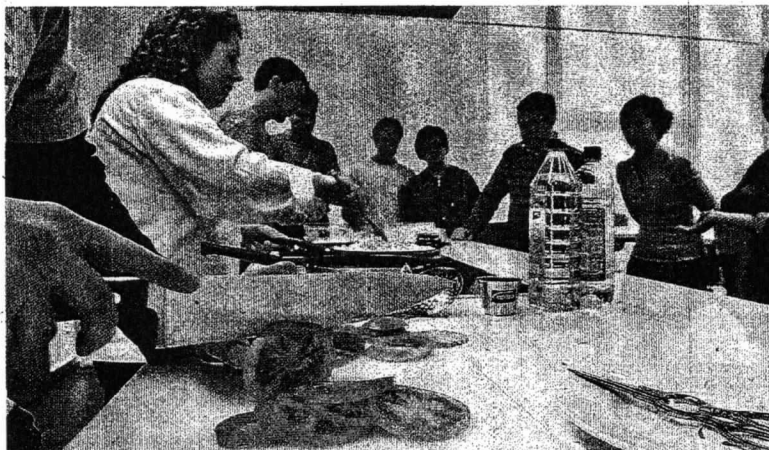
Un curso de cocina impartido en la red de centros cívicos de Vitoria. II IGOR AIZPURI

Esta fue una de las modificaciones incorporadas ayer por el Consistorio tras el debate de las enmiendas de las ordenanzas fiscales cuya tramitación quedaba pendiente, y que entrarán en vigor el 7 de abril. En el paquete de aprobaciones también se incluirá un aumento en las tarifas de la Escuela de Música Luis Aramburu, la Academia de Folklore y el Conservatorio municipal de Danza José Uruñuela. El incremento se repartirá de forma escalona-