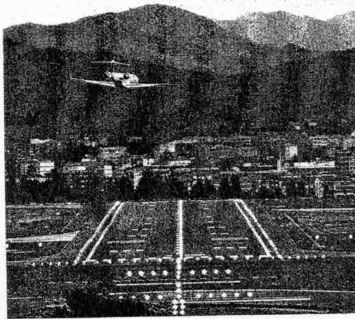
Un avión accede de costado a la pista de Loiu por el viento.